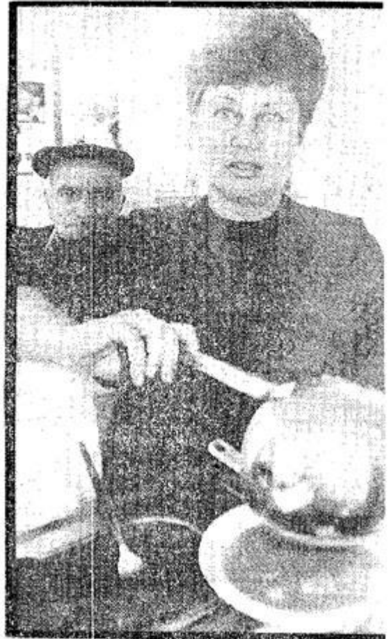
חדשה, מנישה ב' לשובע

עליד חניש אכן מגלה הוסטל לאסירים ורקוסנים שחשתחררו, וקוקים למשנת מטקמת, כדי לא להידרדר שוב לסמים ולמשע. "גנון", כך שמו, מספק לאסירים המשוחררים סוקס לישון בו, לאכול ולהתחיל את חיהם מחדש. שם גם מציעים להם השתלמויות מקצועיות, המשך פיקוח על הגמילה והסגן המוכת. המעון פועל בשיתוף פעולה עם עיריית ת"א ועו והרשויות לשיקום האסיר.